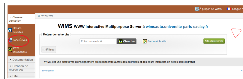
FIGURE 1 – Écran d'accueil