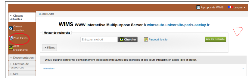
FIGURE 1 – Écran d'accueil