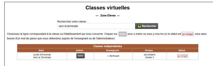
FIGURE 2 – Retrouver la classe