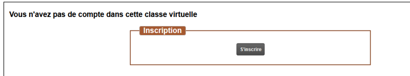
FIGURE 3 – Création d'un compte